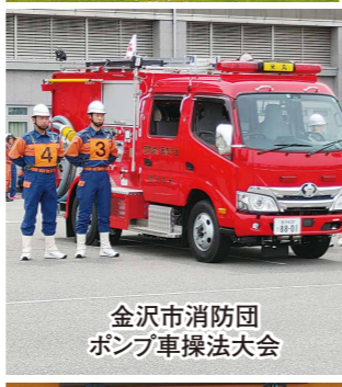
金沢市消防団ポンプ車操法大会