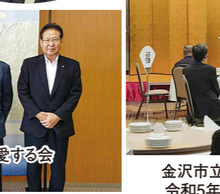
金沢市立工業高等学校 令和5年度同窓会総会