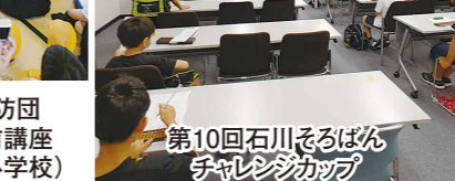
第10回石川そるばんチャレンジカップ