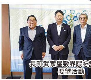
長町武家屋敷数掛事業要望活動