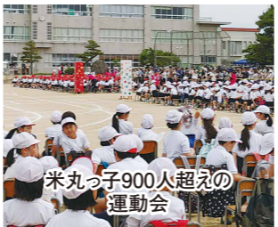
米丸っ子900人超えの運動会