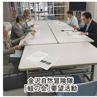
金沢自然冒険隊「蛙の会」要望活動