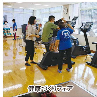
健康づくりフェア