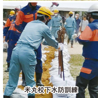
米丸校下水防訓練