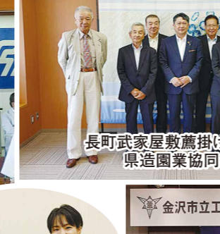
長町武家屋敷数掛事業要望 県造園業協同組合