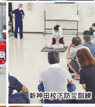
新神田校下防災訓練