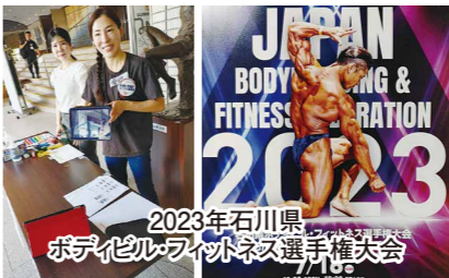
2023年石川県ポデビルフィットネス選手権大会