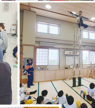
米丸消防団活動出前講座(新神田小学校)