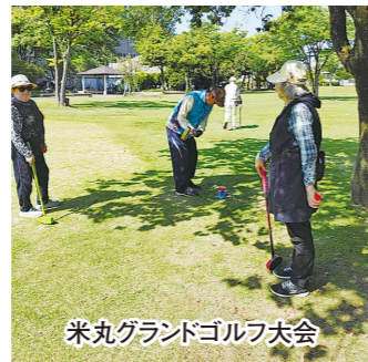
米丸ランドゴルフ大会