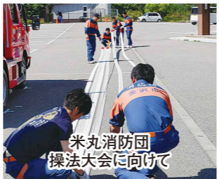
米丸消防団 操法大会に向けて