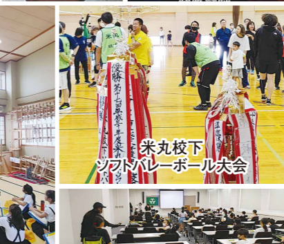
米丸校下ソフトバレーボール大会