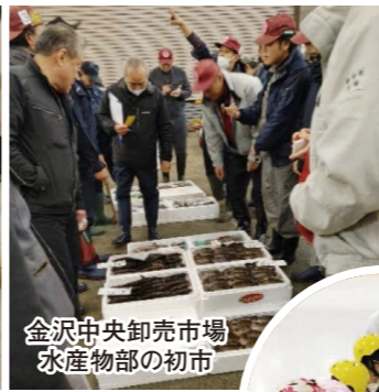
金沢中央卸売市場水産物部の初市