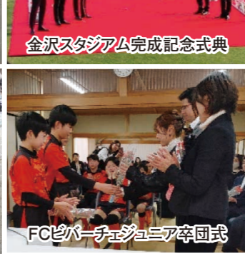
FCビバーチェジュニア卒団式