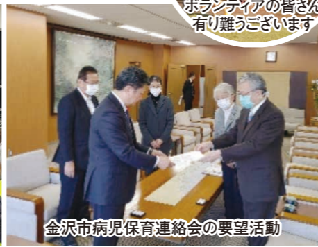
金沢市病児保育連絡会の要望活動