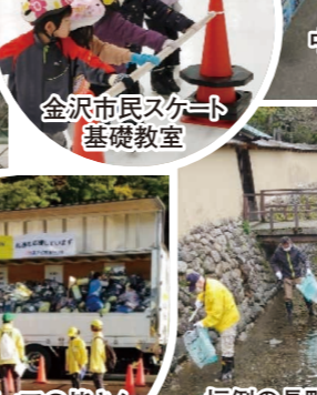
金沢市民スケート基礎教室