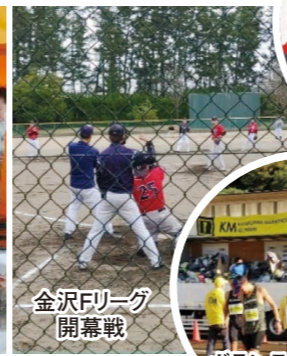
金沢Fリーグ開幕戦