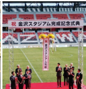
金沢スタジアム完成記念式典