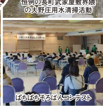
ボランティアの皆さん有り難うございます