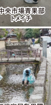
恒例の長町武家屋敷界隈の犬野庄用水清掃活動