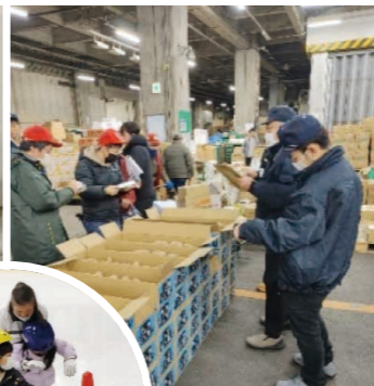
中央市場青果部トマイチ