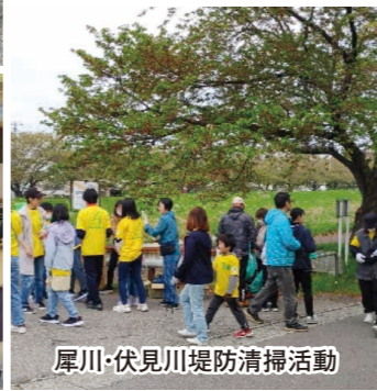
犀川・伏見川堤防清掃活動