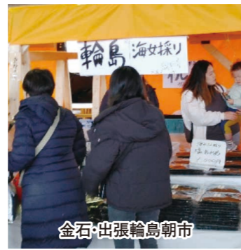
金石・出張輪島朝市