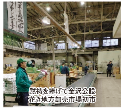
黙祷を捧げて金沢公設花き地方卸売市場初市

出荷要請活動並びにその成果と法改正時代における開設者としての責務と経営展望について。物流機能と情報機能がメインであるはずの再整備工事設計委託業務の公募型プロポーザルと選定委員選考の在り方と情報公開に関する考え方について。再整備事業における特色と留意点並びに国交付金を念頭に置いた事業計画と食品合理化計画の作成、ストックポイントの施設内容と規模及びローリング方式整備手法との関係性と使用料への影響について。再整備事業後の減価償却費、企業債（借入金）に係る元利償還金の支払いなどの経費増加等の収支見込み、財政計画について。金沢市のまちづくりの観点からの卸売市場再整備事業の位置づけ並びにその方向づけ、市場通り商店会の活性化と中小企業振興策について。設計者と市場関係者、開設者の三位一体となった合意形成について。本市の食文化政策推進体制と取組並びに産業振興における卸売市場の位置づけと活用について。